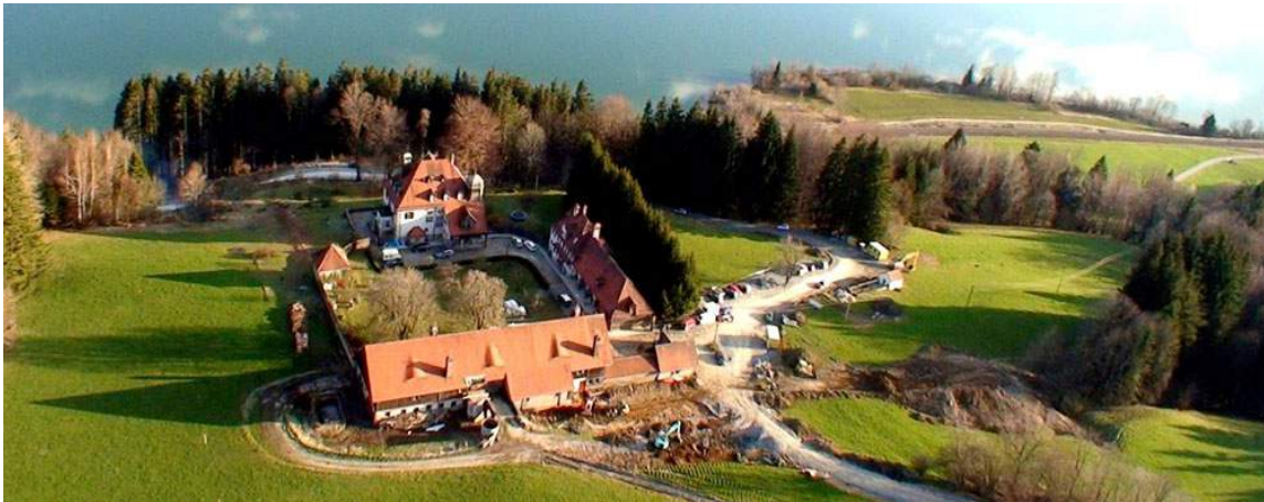
The Europe Center

Het Diamantweg-boeddhisme van de Karma Kagyu Linie biedt dagelijkse meditaties, cursussen, retraite-plekken, studiecursussen en lezingen door meer dan 100 internationale boeddhistische leraren aan.