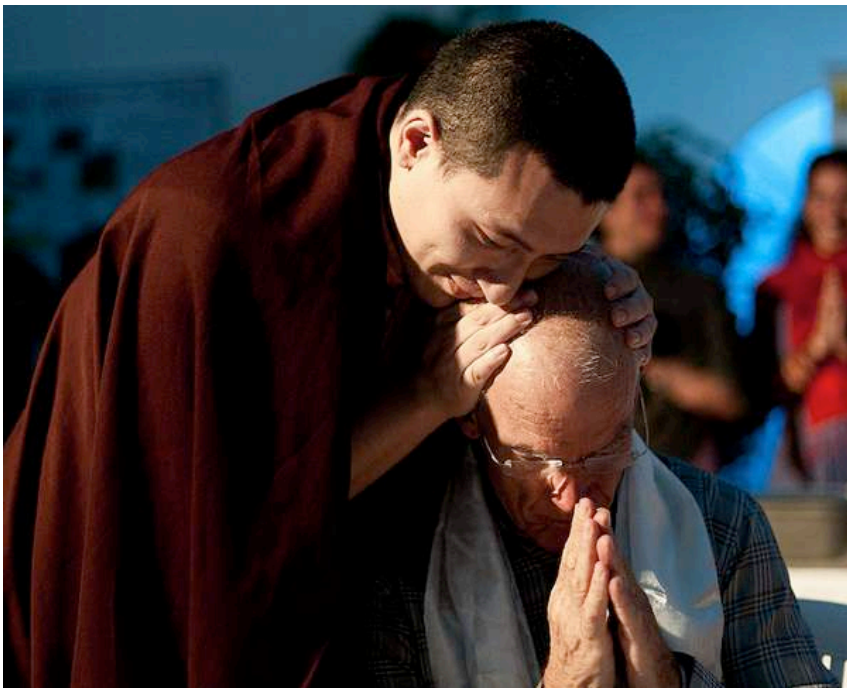
H.H. Karmapa Thaye Dorje commemorates 40 years of work for Buddhism of Lama Ole Nydahl

Wij wensen u al het goede en veel plezier en inspiratie bij het lezen van dit verslag.