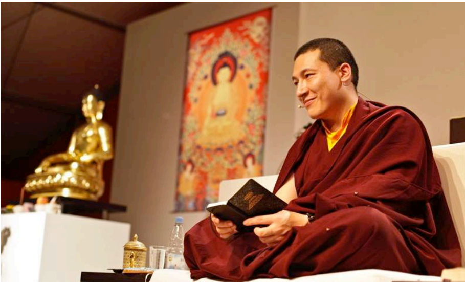
H.H. 17th Karmapa Thaye Dorje

Het Diamantweg-boeddhisme ( Skt.: Vajrayana ) wordt vaak beschreven als het kroonjuweel van Boeddha's onderricht. Doel is het bereiken van de toestand van het Grote Zegel ( Skt.: Mahamudra ), die elke vorm van dualisme overstijgt. Alle gebeurtenissen zijn echt en waar omdat ze de onbegrensde mogelijkheden van de geest laten zien, maar tegelijk zijn ze ook een illusie omdat ze vergankelijk zijn. Door directe en totale identificatie met verlichting, de volledige ontplooiing van de geest, worden snelle resultaten mogelijk gemaakt.